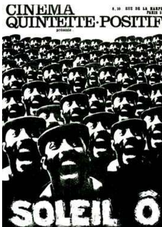
Poster do filme Soleil Ô

Vemos que apesar de parecer uma oportunidade de uma vida melhor, que traria somente benefícios, a migração também causa conflitos até fatais em casos, naqueles que saem de seus territórios atrás de fronteiras mais promissoras. Estas narrativas de ficção da época muito se assemelham com o contexto atual de migrações mundo a fora. Vemos assim como é recorrente, não só no cinema, a questão da migração dos povos.