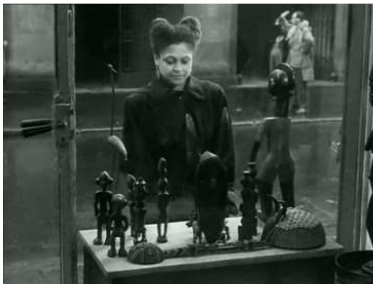
Cena de As Estátuas Também Morrem mostrando estátuas africanas em museus franceses

Impulsionado por todas as pressões que fervilhavam o mundo na época, um estudante africano em Paris grava o primeiro filme feito por um africano negro, África sobre o Sena (1995) de Paulin Vieyra, antes mesmo dos filmes anticolonialistas dos cineastas franceses. O filme de Vieyra mostra como imigrantes africanos viviam em Paris, as dificuldades sofridas pela vida no exílio e as diferenças culturais ocasionadas pelos contrastes entre os indivíduos. Tais situações retrataram no filme muito das experiências que próprio cineasta vivia, sendo um africano a viver na Europa (GOMES, 2013).