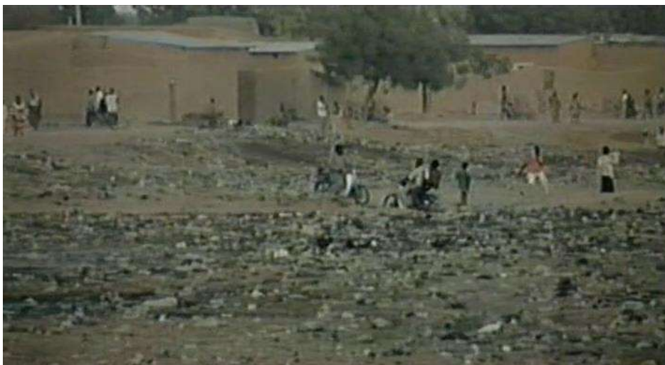
Paisagem do centro urbano do Chade