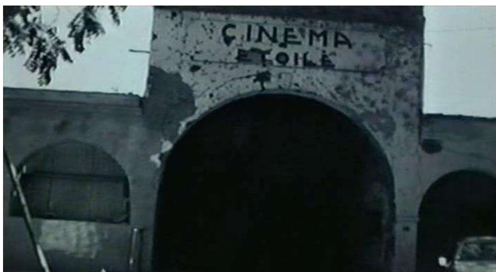
Estado dos cinemas da capital do Chade